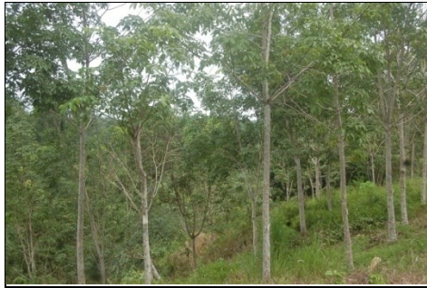
Gambar 1. Areal Tanaman Karet