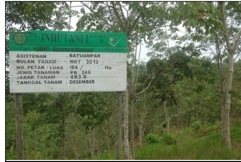
Gambar 2. Papan Keterangan